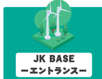
JK BASE - エントランス -